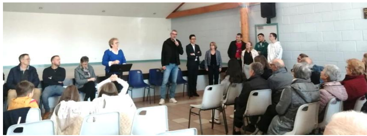
Accueil des nouveaux habitants lors de la cérémonie des vœux, le samedi 11 janvier 2025 en présence de Monsieur Antoine VERMOREL-MARQUES, Député de la Loire